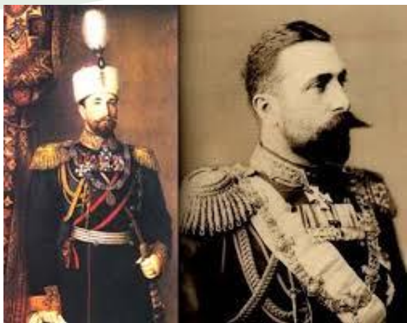
На Гергьовденския парад