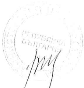
ТЕМЕНУЖКА ПЕТКОВА Министър на енергетиката